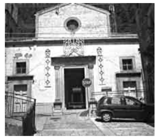
LA CHIESA MADRE DI FLORESTA